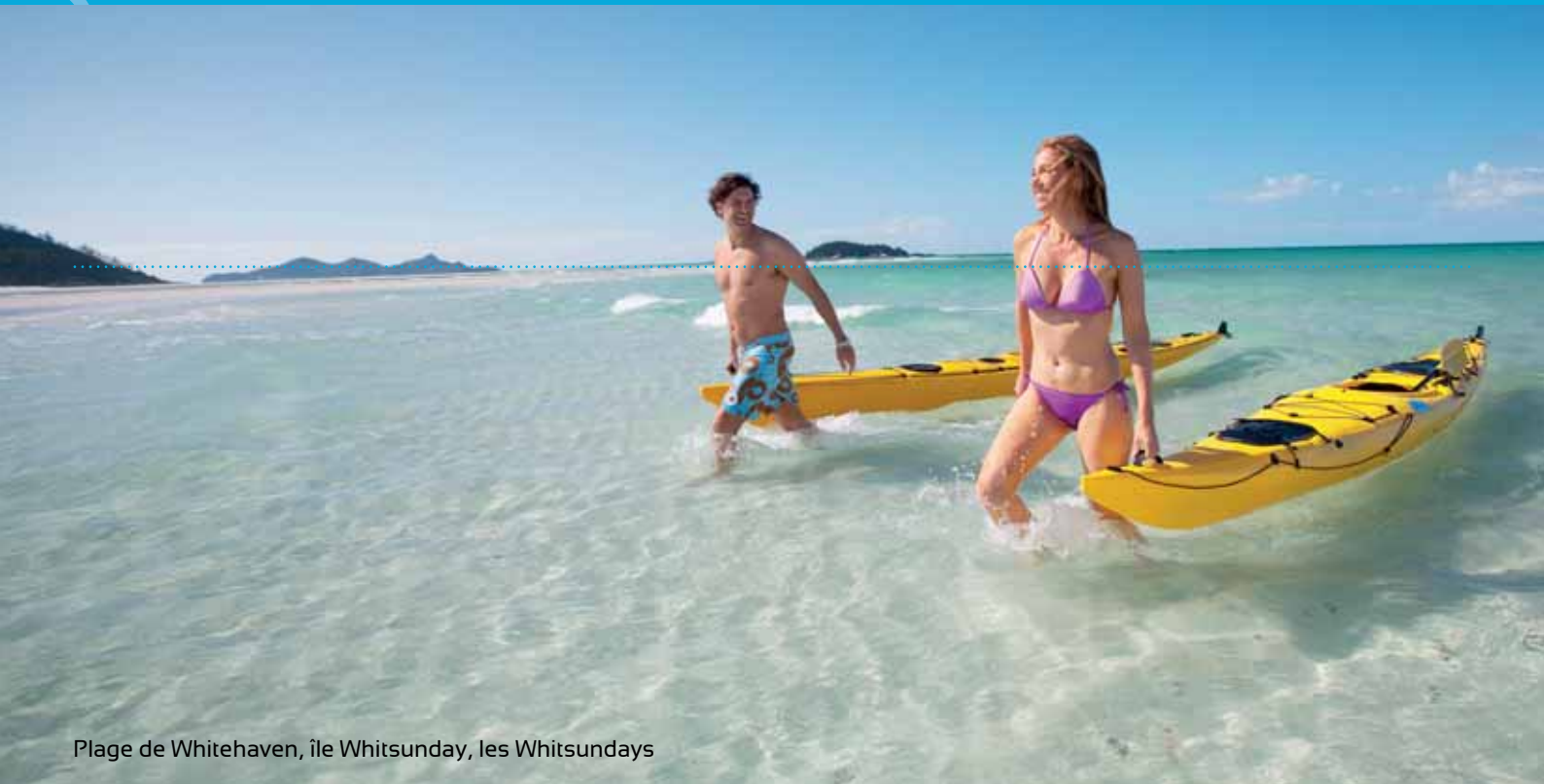
Plage de Whitehaven, île Whitsunday, les Whitsundays