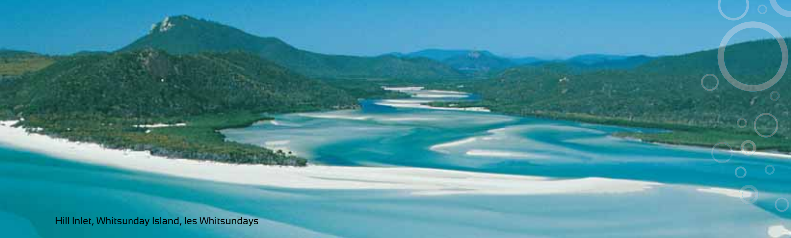
Hill Inlet, Whitsunday Island, les Whitsundays