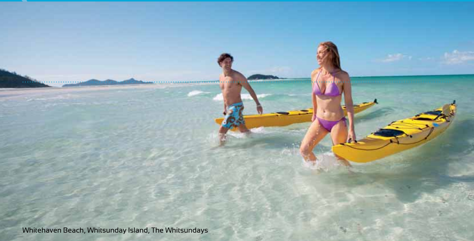
Whitehaven Beach, Whitsunday Island, The Whitsundays